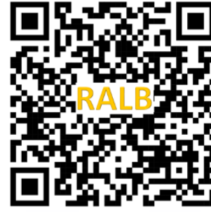
Material digital gratuito para estudio de la Biblia