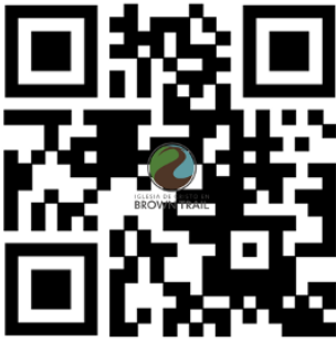
Website de la iglesia de Brown Trail

1801 Brown Trail, Bedford, TX 76021 | www.btidc.org | btiglesiadecristo@gmail.com | (817) 681 4543 www.btsop.org | www.laverdadenamor.com