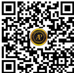
Libros por Alvarenga Publications