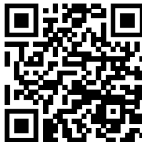
Servicios en vivo para campanas en auditorio de la iglesia de Brown Trail