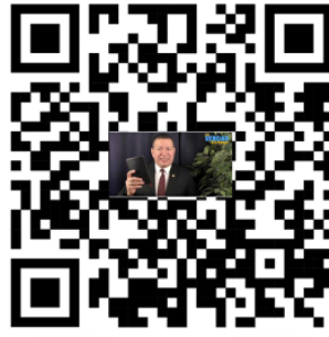
Programación de La Verdad en Amor